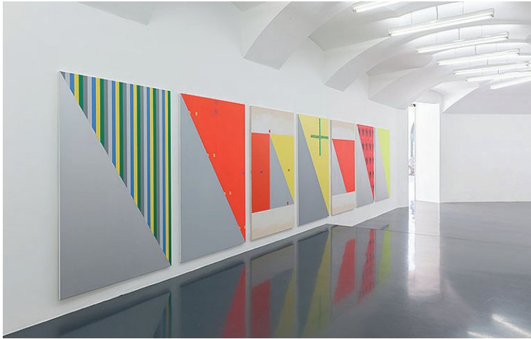
Sophie Stadler, 10.07.19